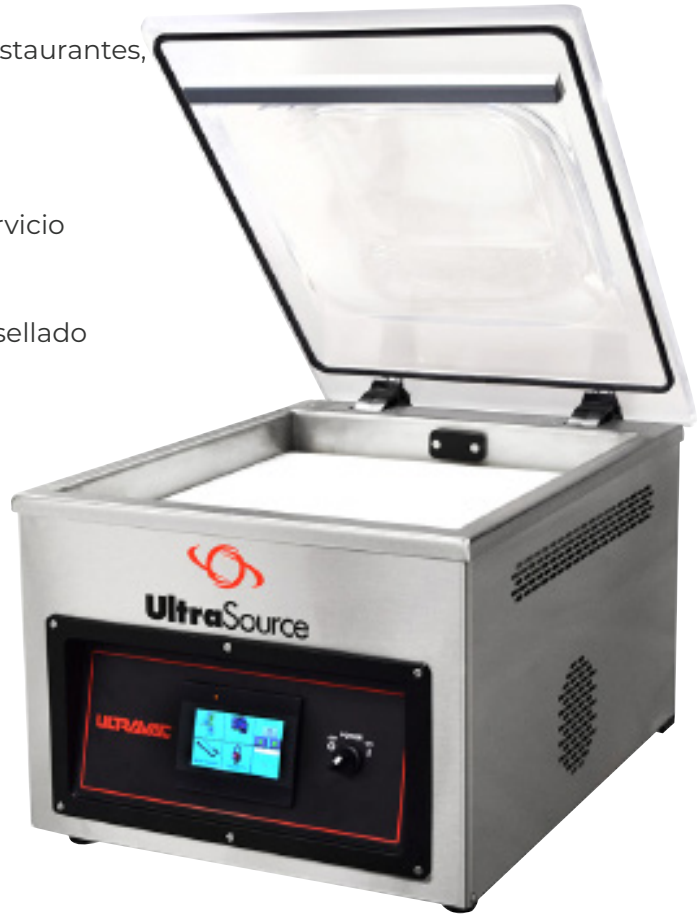
Mostrado con pantalla táctil opcional